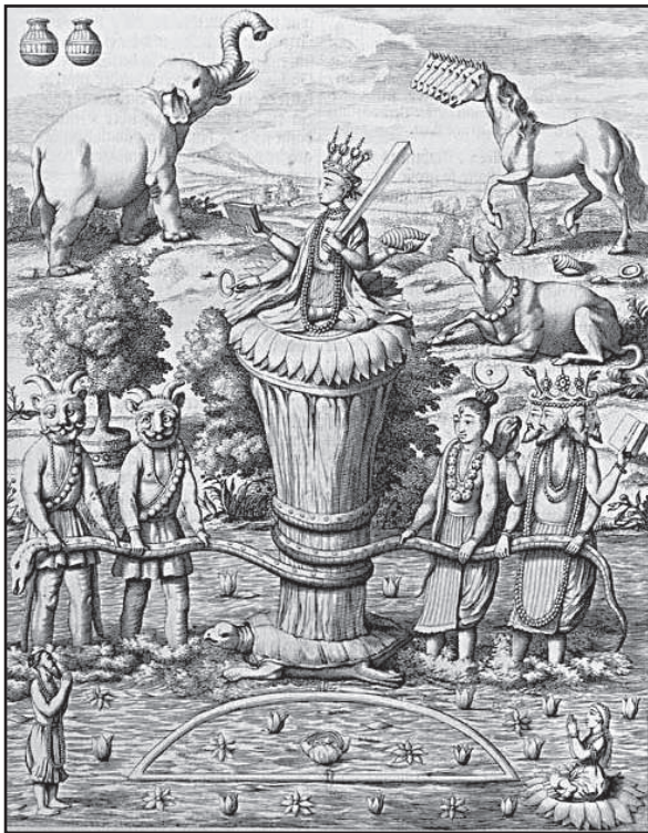
A tejóceán kőpülése – Philippus Baldacus metszete

Minden népnek vannak mítoszai a szó autentikus, nem pedig becsmérlő értelmében, vagyis rendelkeznek a szellemi tudás eredetileg nem leírt, szóban hagyományozott, írásbeliség előtti formáival, melyek közvetlen kapcsolatban állnak minden történetmesélés lényegével. Vannak mítoszai a turáni népeknek, az amerikai indiánoknak, az afrikai és afrikai eredetű 6 népeknek. Az ausztrál őslakosoknak is. A történetmesélés univerzális jelenség, ám a mítoszok valóban, birtokolt módon egyetemesek.