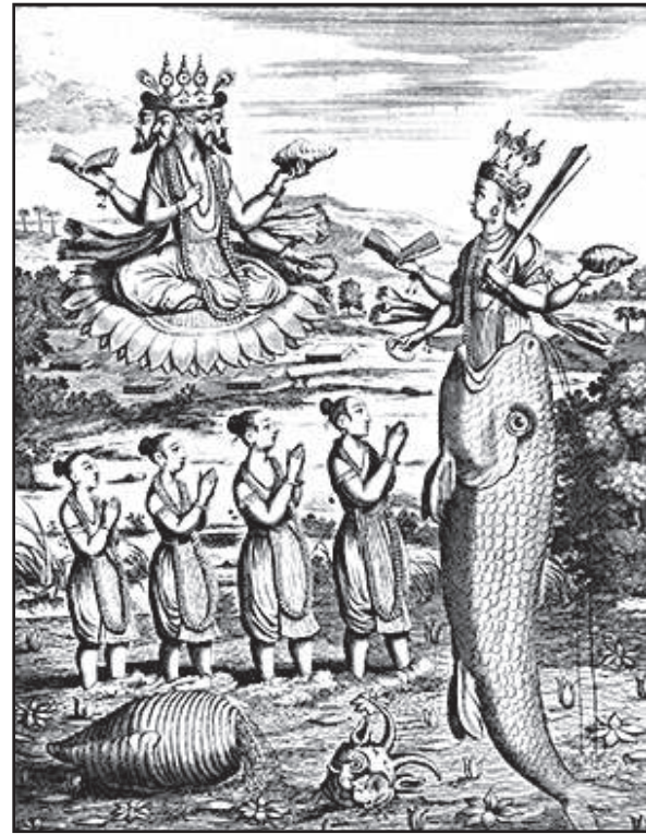
Philippus Baldaneus (1632–1671) metszete

Ami a történelmi – vagyis egy harmadlagos – szempontot illeti, a történetmesélés eredeti és legmagasabb formáit a mítoszok jelentették. Mindaz,